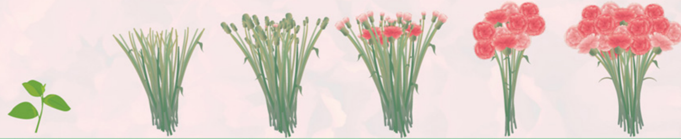
Plan Propagación Plan Siembra Plan Despunte o Pinch Plan Vegetativo Plan Desbotone Plan Producción Plan Repique